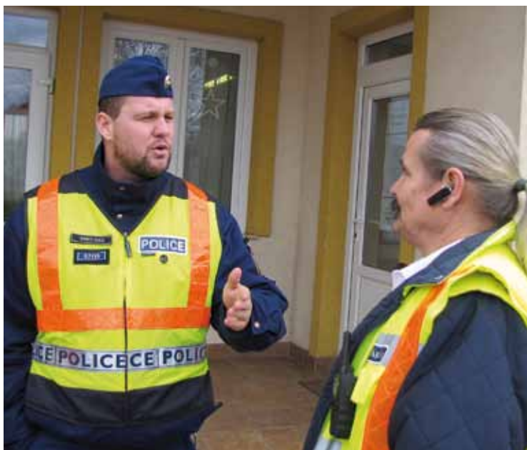
Eredményes a rendőrség és a polgárőrség együttműködése

Lehetőleg az udvarban parkoljunk autóinkkal, de még ott is zárjuk le, ne hagyjunk az utastérben értéket, csomagot. Ha a kertben tevékenykedünk, zárjuk be a bejárati ajtót.