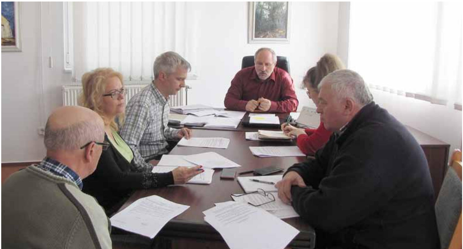
A képviselők döntöttek a sportpálya melletti terület megvásárlásáról is