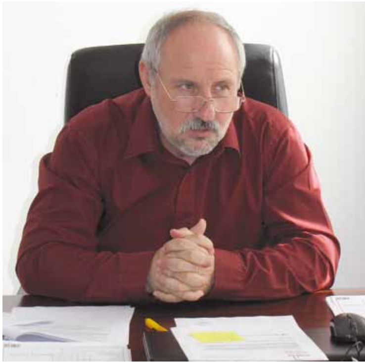
Az ipari park területén újra kell tervezni az ivóvíz-rendszert

A Sportegyesület vízi szakosztálya feléledt, valamint vízi motoros szakosztály is alakulóban van. Számtalan terv van a tarsolyunkban, de mindezeknek fontos feltétele