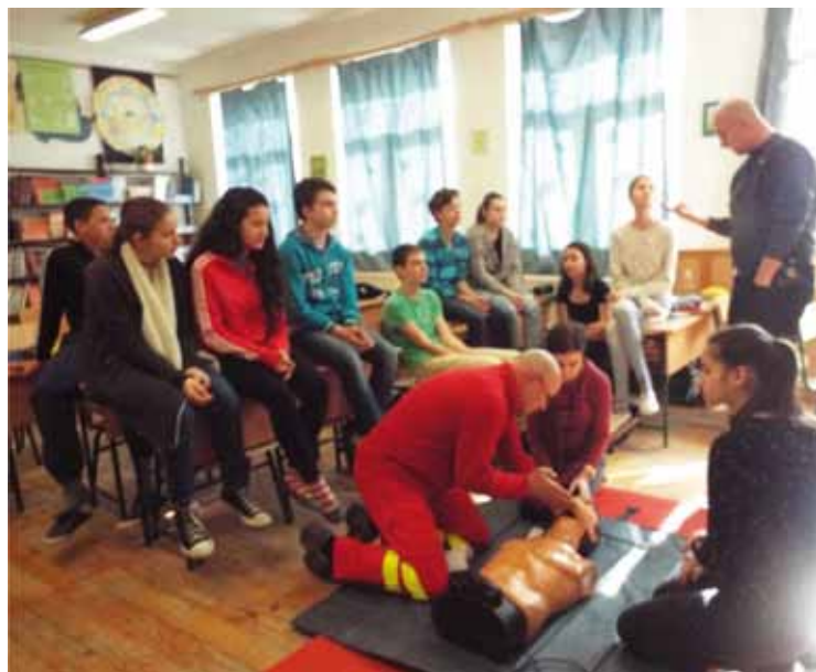
A helyes újraélesztést tanulták a gyerekek

gyó biológia óra keretében mutatták be tanulóinknak az újraélesztés szabályait.