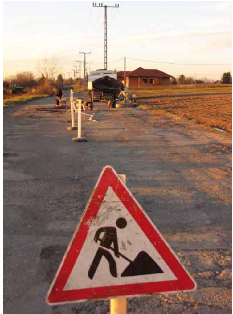
A csatornázás mérnökcsoportja április végére fog összeállni

– Az ipari parkunkba olyan új vállalkozás költözött, mely 50 fő foglalkoztatását tervezi. A vállalkozásnak (a tevékenységéből adódóan, a tűzvédelmi szakhatósági előírásoknak megfelelően) jelentős tűzvizet kell biztosítani a telephelyen. Ez tárta fel a problémát, hogy a jelenlegi ivóvízrendszer az ipari park területén erre alkalmatlan, sőt, teljesen illegális. A meglévő rendszer újratervezése, megépítése és legalizálása mindenképpen szükséges ezen a körülbelül másfél kilométeres szakaszon – tájékoztatta lapunkat a polgármester.